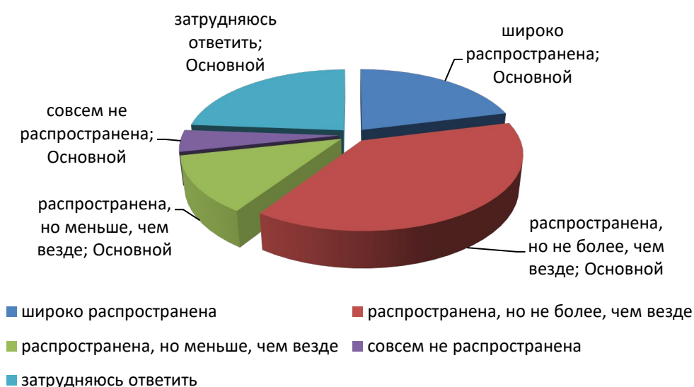
Рис. 2. Оценка респондентами остроты распространенности наркомании в Красноярском крае