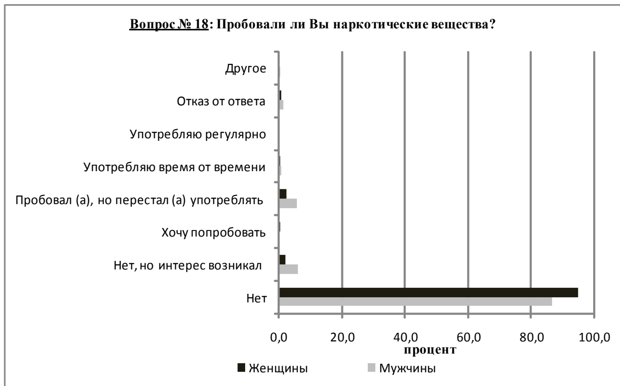
Рис. 2. Опыт пробы респондентами наркотиков в зависимости от пола, %

Из представленного видно, что среди респондентов, имеющих опыт употребления наркотика, преобладают мужчины, хотя среди опрошенных не выявлено ни одного мужчины и ни одной женщины, регулярно употребляющих наркотики; среди