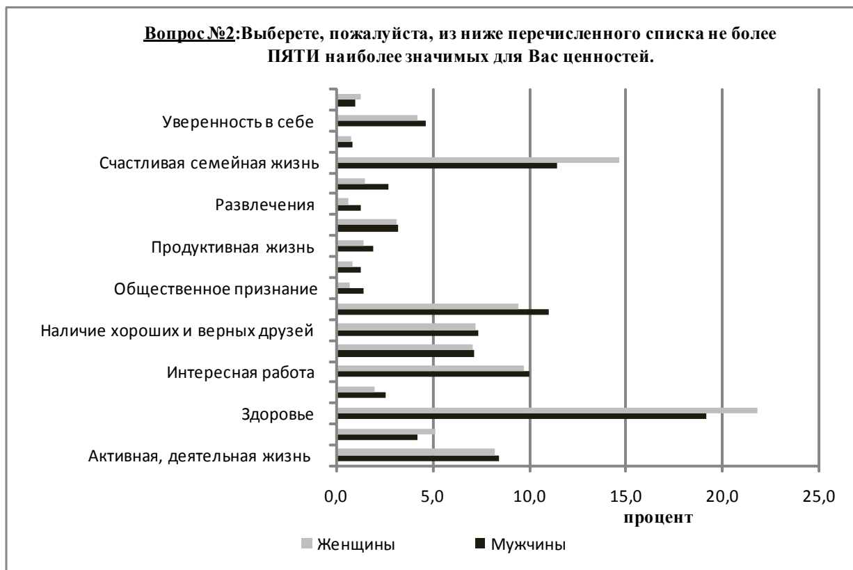
Рис. 1. Наиболее значимые ценности опрошенного населения Красноярского края в зависимости от пола респондентов

Доминирующая система ценностей индивида определяет, в свою очередь, и структуру его повседневных досуговых практик: в зависимости от того, какие ценности стоят на первом месте, можно судить о способах проведения свободного времени, и наоборот. Оценка возможностей и средств, позволяющих разным группам организовывать свой досуг, косвенно может свидетельствовать также и о ценностных установках на употребление наркотиков.