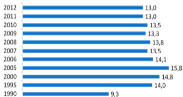
Рис. 3. Общие коэффициенты смертности (на 100 тыс. населения)

Кроме этого стоит отметить уменьшение дифференциации доходов населения. Коэффициент фондов (характеризует степень социального расслоения и определяется как соотношение между средними уровнями