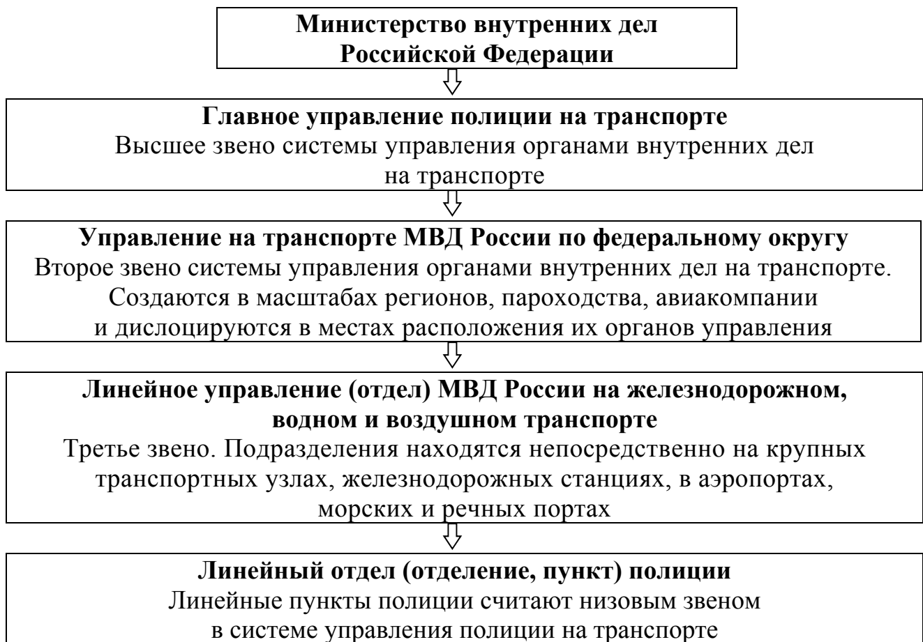
Рис. 1. Система органов внутренних дел на объектах водного и воздушного транспорта

Структура органов внутренних дел на транспорте во многом схожа со структурой территориальных отделов полиции, но при этом в ней отсутствуют службы участковых уполномоченных, ГИБДД и др. Несмотря на отсутствие в структуре линейных органов внутренних дел ряда служб, присущих территориальным ОВД, в ней имеются подразделения, характерные только для линейных органов внутренних дел, например отдел (отделение) организации борьбы с преступными посягательствами на грузы.