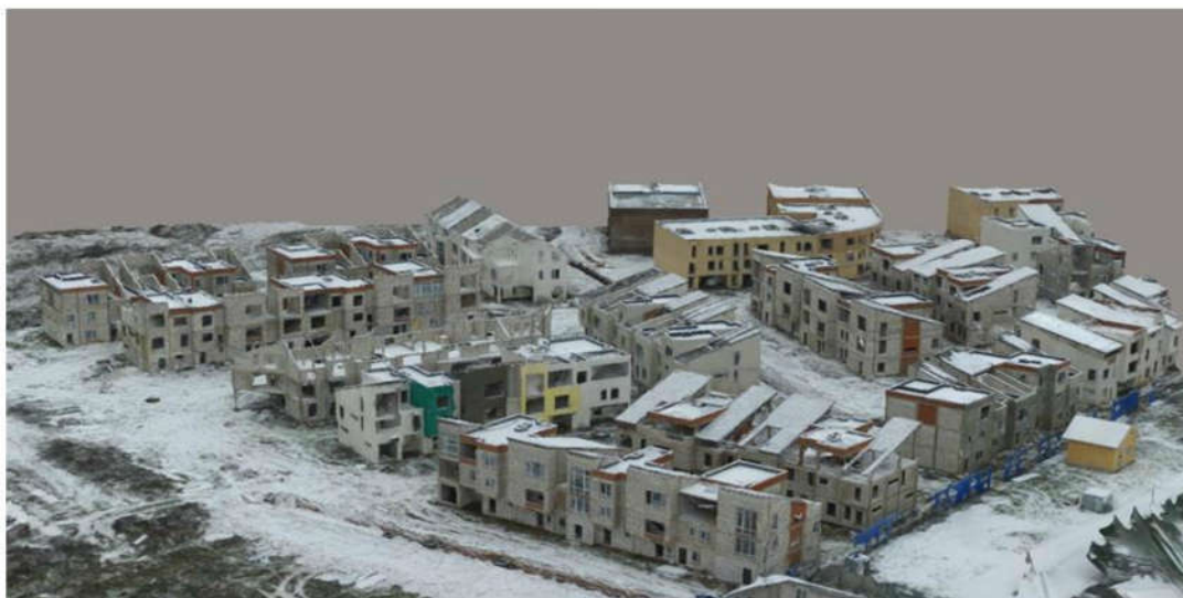
Рис. 1. Жилой квартал, не завершённый строительством, на территории Московской области

Преступления, связанные с массовыми хищениями денежных средств граждан при строительстве многоквартирных домов (финансовые пирамиды), носят общественно резонансный характер, сопряжены с нанесением ущерба широкому кругу граждан и организациям и, как правило, расследуются под контролем руководства МВД России (рис. 1).