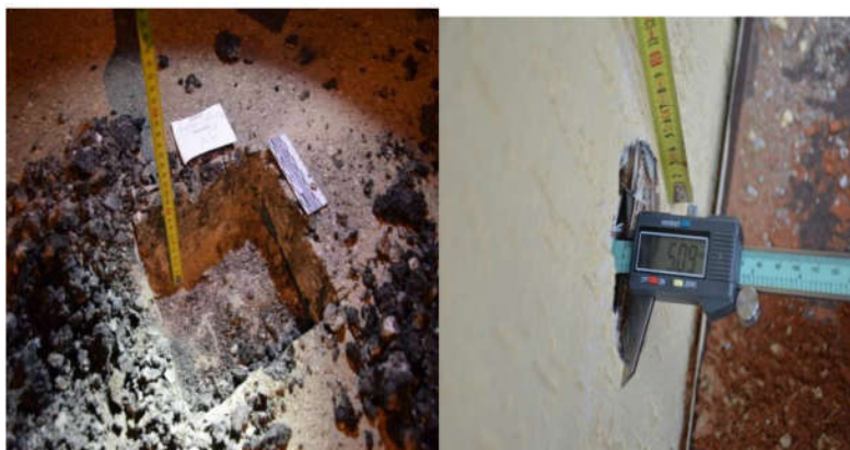
Рис. 3. Примеры последствий локального применения разрушающих методов исследования

3. Проблематичность применения разрушающих методов исследования и диагностики скрытых строительных работ применительно к многоквартирным домам, обусловленная потребностью в восстановлении причиненного локального ущерба строительным конструкциям (рис. 3).