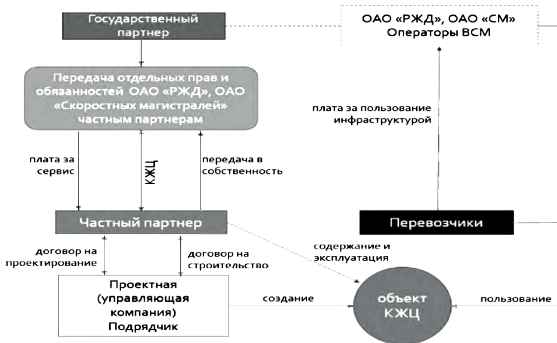
Рисунок – Модель контракта жизненного цикла. Схема создания инфраструктуры ВСМ 2

соналом. Это исключает коррупцию, так как некому давать взятки. Контракт жизненного цикла означает предоставление услуг (работ) по отношению к качественной инфраструктуре по доступным ценам на протяжении всего жизненного цикла объектов инфраструктуры, задействованных в проекте, а также заключение единого договора с исполнителем 1 . Объединение всех этапов проекта (проектирование, строительство, эксплуатация) в единый контракт значительно снижает производственные и эксплуатационные риски и существенно снижает финансовые затраты. Ошибки, допущенные при проектировании, могут навредить только подрядчикам, но не госзаказчикам [4]. Самый главный плюс контракта жизненного цикла в сфере транспортной инфраструктуры заключается в том, что государство не вкладывает деньги в проектирование, строительство и эксплуатацию дороги, а покупает услуги уже работающей дороги (см. рисунок).