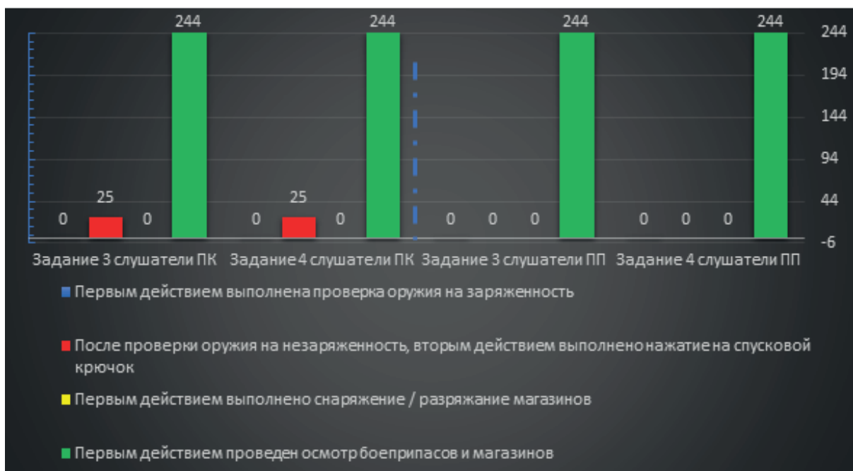
Рис. 4. Графическая иллюстрация выполнения 3 и 4 задания с применением схемы и алгоритма действий сотрудника при получении оружия и подготовке его к несению службы и при сдаче оружия после окончания несения службы

Обобщая вышеизложенное, мы видим, что к происшествиям, связанным с небрежным (неумелым) обращением с оружием при получении и сдаче оружия и боеприпасов в дежурных частях органов внутренних дел, приводит отсутствие точной последовательности действий с оружием, выраженное в беспорядочности выполнения этих действий. Проведенный педагогический эксперимент позволяет аргументировать целесообразность использования схемы и алгоритма действий сотрудника при получении и сдаче оружия и боеприпасов в дежурных частях органов внутренних дел в качестве комплекса дополнительных мер по повышению уровня профессиональной подготовки сотрудников и снижению случаев гибели и получения травм.