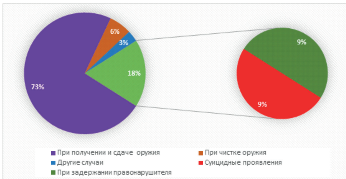
Рис. 1. Статистика неправомерного применения огнестрельного оружия

Приведенная статистика свидетельствует о том, что даже предпринимаемые меры, такие как: допуск сотрудника по одному в комнату для получения и сдачи оружия;