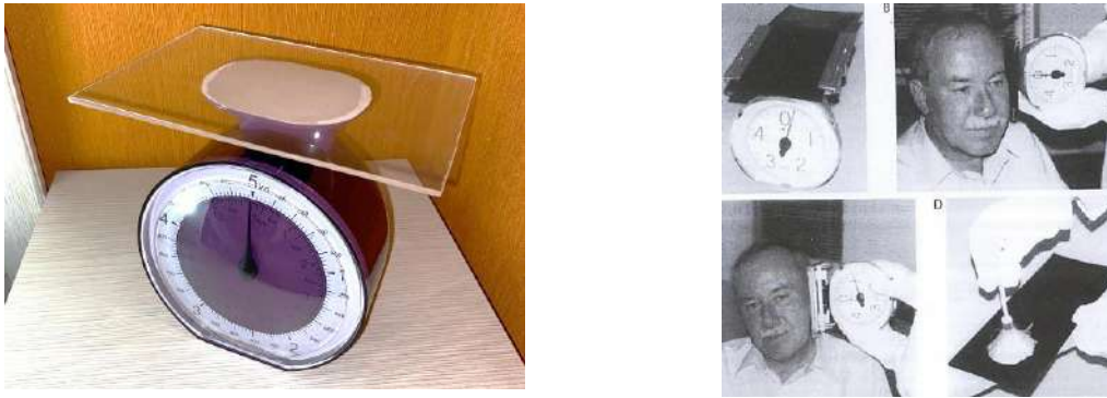
Рис. 2. Прибор для получения экспериментальных оттисков ушной раковины (отометр)

4. Стадия сравнительного исследования – выявление совпадающих и различающихся признаков в исследуемых объектах по общим признакам (форме и размерам следов в целом), а также по частным признакам (размерам и характерным особенностям отдельных элементов строения ушной раковины; наличию морщинок и складок на элементах ушной раковины; наличию увеличенной по вертикали мочки; характеру волосяного и кожного покрова ушной раковины и т. д. (рис. 3).