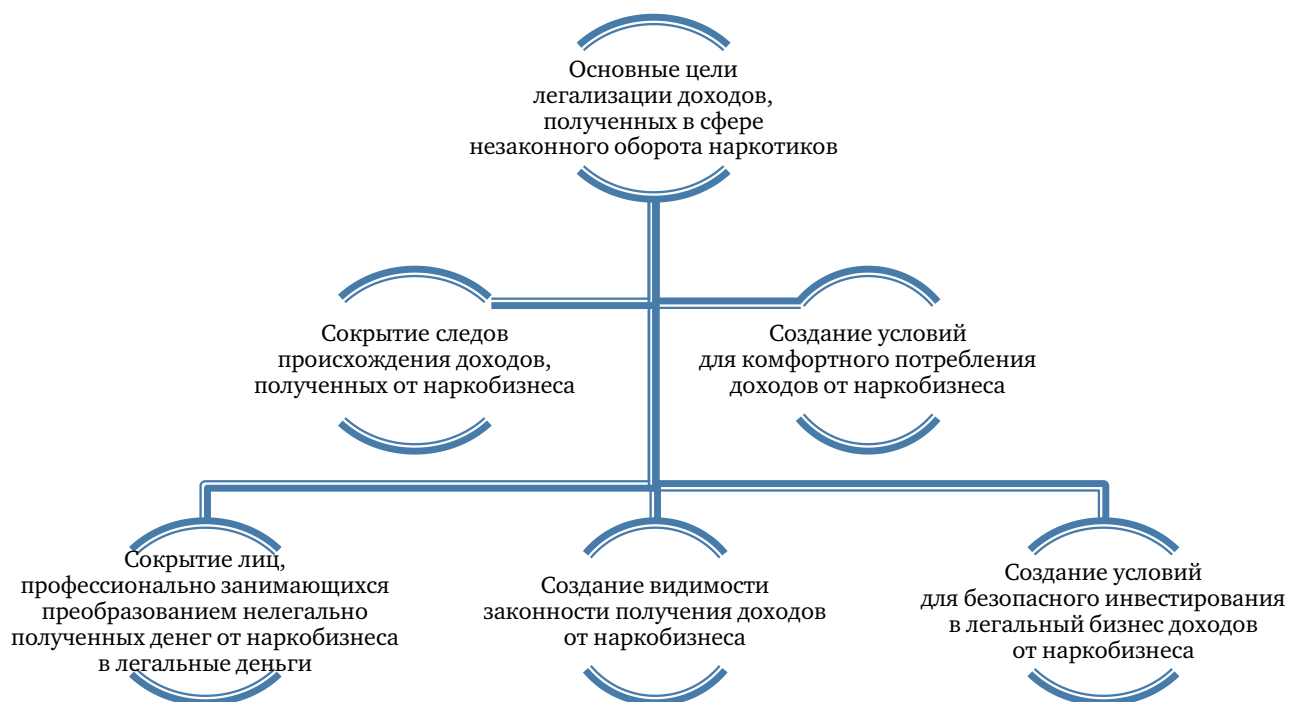
Рис. 3. Основные цели легализации доходов, полученных в результате незаконного оборота наркотических средств, психотропных веществ и их аналогов

Как известно, следствие по делу о легализации преступных доходов, где основным предикатным преступлением является преступление в сфере незаконного оборота наркотических средств, психотропных веществ и их аналогов, ведется на базе данного уголовного дела.