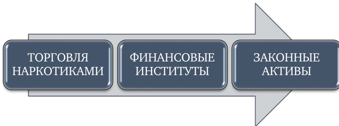
Рис. 1. Принципиальная схема легализации преступных доходов

незаконного оборота наркотических средств, психотропных веществ и их аналогов, должны соответствовать двум основным требованиям, а именно, быть направленными на отмыwanie доходов от незаконного оборота наркотических средств, психотропных веществ и их аналогов (придание вида правомерного владения) и выглядеть правомерно приобретенными, т. е. иметь вид законного и добросовестного владения, при котором скрыт действительный криминальный путь их происхождения, не допуская предположений со стороны следственных органов об использовании преступных доходов от незаконного оборота наркотических средств, психотропных веществ и их аналогов как доказательств совершения предикатного наркопреступления.