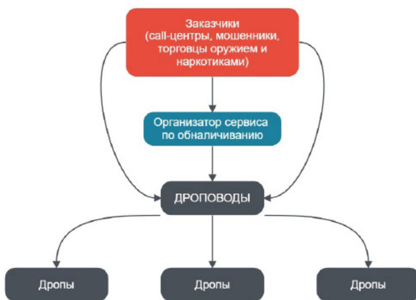
Организационная структура сервисов по обналичиванию похищенных денежных средств

С небольшими вложениями и нарабатанной репутацией на интрнет-площадках «дропп» или «дропповод» имеет шанс выйти на уровень владельца сервиса по обналичиванию (обнал-сервиса). На теневых форумах «дроппам» оказывается консультативная поддержка, распространяются скрипты общения с ОВД. Зачастую сообщники задержанных «дропповодов» нанимают своим «коллегам» дорогостоящих адвокатов.