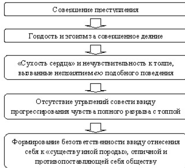
Рисунок 1 – Последствия совершения преступления по Г. Тарду Picture 1 – Consequences of crimes according to G. Tard

поскольку он порицаем обществом, а также стремление «отплатить честной толпе презрением за презрение, что является лишним способом отражать ее взгляды, отталкивая ее» [6].