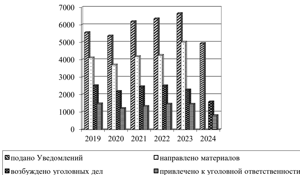
Диаграмма 2. Основные показатели эффективности института уведомлений