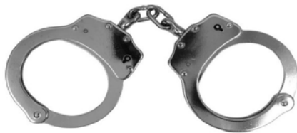
Рисунок 3. Наручники

3. Средства ограничения подвижности, к ним относятся наручники. Наручники – это специальное средство пассивного действия, конструктивно выполненное в виде двух колец с замками, соединенных между собой и используемых сотрудниками правоохранительных органов для ограничения подвижности задержанного (рисунок 3). Наручники надеваются на кисти рук и в той или иной степени ограничивают свободу действий лица, в отношении которого применены 3 . Средства ограничения подвижности применяются в случаях, предусмотренных пунктами 3, 4 и 6 части 1 статьи 21 ФЗ «О полиции».