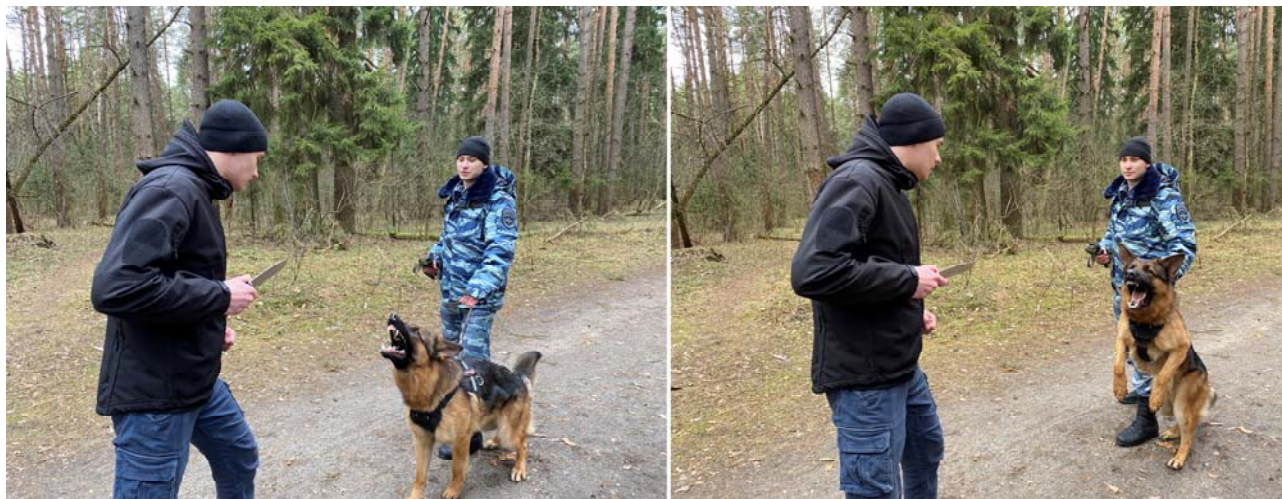
Рисунок 18. Отражение нападения на специалиста-кинолога

Также нападение на специалиста-кинолога и служебную собаку может представлять активные действия преступника, начинающиеся на удалении (рисунок 18). Специалист-кинолог, предупредив окриком о применении служебной собаки, снимает с нее специальное снаряжение и, если преступник не прекратил провокационные действия, подает собаке команду «Фас!», а затем отпускает ее. Служебная собака задерживает преступника хватом и ведет борьбу с ним. В момент приближения служебной собаки преступник может попытаться испугать ее различными брошенными в нее предметами, на которые служебная собака не должна обращать никакого внимания. При прекращении активных действий преступника служебная собака самостоятельно отпускает хват и переходит в фазу удержания. Специалист-кинолог подходит к служебной собаке и берет ее на поводок либо отзывает, в зависимости от ситуации.