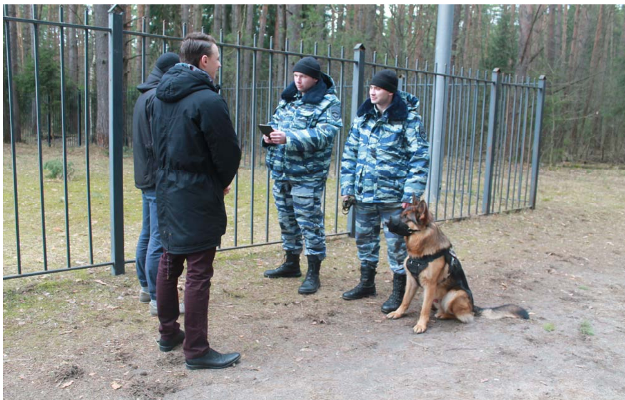
Рисунок 19. Проверка документов

При попытке правонарушителя своими активными действиями причинить вред сотрудникам полиции, завладеть их огнестрельным оружием специалист-кинолог применяет служебную собаку. В случаях, когда проверяемое лицо пытается воспрепятствовать сотруднику полиции, сотрудник полиции вправе применить специальные средства, физическую силу. В случаях если правонарушителю удалось отдалиться на достаточное расстояние от сотрудника полиции вследствие борьбы или побега, специалист-кинолог может применить служебную собаку на задержание, убедившись, что между правонарушителем и служебной собакой нет посторонних лиц и вероятность их появления крайне мала. Необходимо удостовериться в том, что служебная собака четко видит правонарушителя и, при необходимости, направить жестом в сторону него. После предупредительного окрика служебная собака направляется по команде «Фас!» или «Атака!», производит хват, вследствие чего правонарушитель прекращает активные действия. Специалист-кинолог после пуска служебной собаки на задержание незамедлительно следует за ней, в случае если активные действия после хвата служебной собаки продолжаются, специалист-кинолог и сотрудники полиции ограничивают свободу правонарушителя с помощью специальных средств и боевых приемов борьбы. После этого следует команда на отзыв служебной собаки.