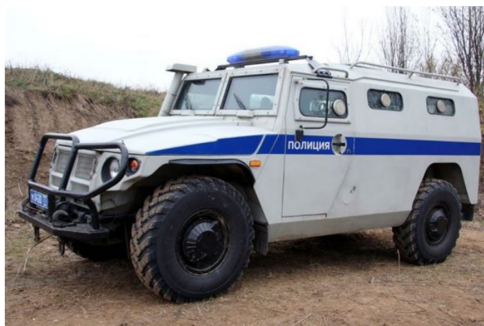
Рисунок 12. Бронемашина

12. Бронемашины (рисунок 12) – это специальные автомобили, которые предназначены для патрулирования жилых зон, разведки, перевозки и безопасности личного состава (БТР-80, БМД-1). Бронемашины применяются в случаях, предусмотренных пунктами 5, 7, 8 и 11 части 1 статьи 21 ФЗ «О полиции».