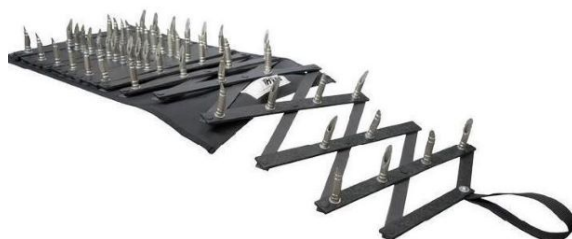
Рисунок 9. Средство принудительной остановки транспорта

9. Средства принудительной остановки транспорта (рисунок 9) – это технические приспособления, с помощью которых осуществляется принудительная остановка транспортных средств («Диана», «Гарпун»). Запрещается принудительно останавливать транспорт, который перевозит пассажиров, транспорт дипломатических и консульских учреждений, мотоциклы, мопеды, мотоколяски, мотороллеры, а также использовать средства принудительной остановки на определенных участках дороги (горные районы, ограниченная видимость, мосты, эстакады, тоннели). Средства принудительной остановки транспорта применяются в случаях, предусмотренных пунктами 9 и 11 части 1 статьи 21 ФЗ «О полиции».