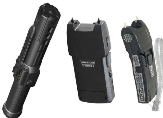
Рисунок 5. Электрошоковые устройства

5. Электрошоковые устройства – это технические средства, которые используют электрические импульсы высокого напряжения (рисунок 5). К данным устройствам относятся электрошокеры. Электрошоковые устройства применяются в случаях, предусмотренных пунктами 1–5, 7 и 8 части 1 статьи 21 ФЗ «О полиции».