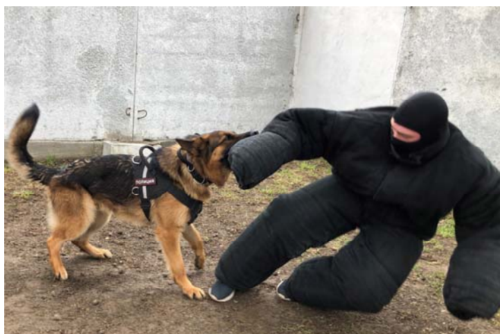
Рисунок 7. Служебная собака

7. Служебные животные, к данным специальным средствам относятся служебные собаки и лошади. Служебные собаки являются надежными помощниками в борьбе с правонарушителями (рисунок 7). Наиболее распространенными породами служебных собак являются немецкая овчарка, бельгийская овчарка (малинуа), восточноевропейская овчарка, лабрадор, ротвейлер. Служебные животные применяются в случаях, предусмотренных пунктами 1–7, 10 и 11 части 1 статьи 21 ФЗ «О полиции».