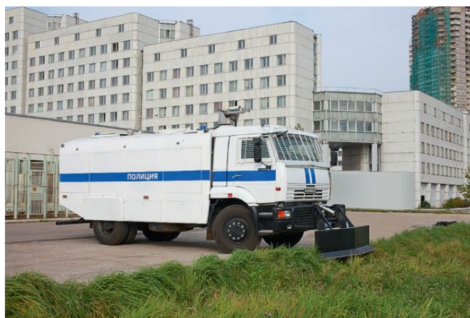
Рисунок 11. Водомет

11. Водометы (рисунок 11) – это технические средства, которые применяют поток воды под давлением для остановки противоправных действий. Струя воды под давлением оказывает непосредственное воздействие на правонарушителей. Запрещается применять водометы при температуре воздуха ниже 0 °С. Применение водометов осуществляется по решению руководителя территориального органа с последующим уведомлением прокурора в течение 24 часов. Водометы применяются в случаях, предусмотренных пунктами 7, 8 и 11 части 1 статьи 21 ФЗ «О полиции».