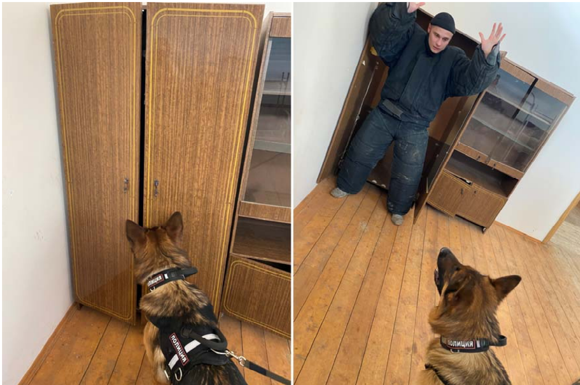
Рисунок 17. Тренировочные занятия по обнаружению преступника в помещении

После использования химических средств в здании применение служебной собаки на задержание не рекомендуется.