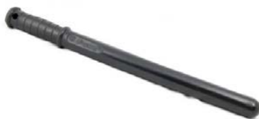
Рисунок 1. ПР-73

1. Палки специальные, к ним относятся палки резиновые (ПР-73; ПР-89; ПР-90). Модификации палок резиновых созданы с учетом обстановки их применения. Данное специальное средство используется большинством подразделений органов внутренних дел, в том числе полицейскими-кинологами. Палка специальная применяется в случаях, предусмотренных пунктами 1–5, 7, 8 и 11 части 1 статьи 21 ФЗ «О полиции» (рисунок 1).