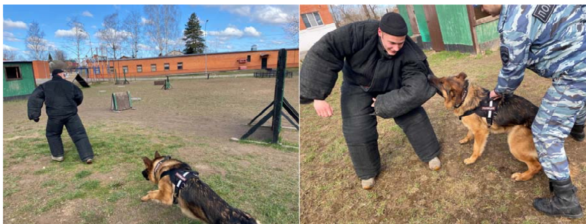
Рисунок 16. Розыск и задержание человека, совершившего побег

1. Розыск, обозначение и удержание человека, совершившего побег: служебная собака преследует убегающего преступника, который в дальнейшем скрывается в помещении или на местности (рисунок 16). Территория, на которой может находиться преступник (объект), может представлять из себя естественную или искусственно ограниченную зону. В основном обнаружение должно происходить с помощью обоняния и слуха. Местность делится по наполнению среды: обедненная (пустыри, поля с минимальным количеством растительности, строительные площадки, подготовленные к застройке), с умеренным количеством находящихся на ней объектов (одиноко стоящие деревья, негустой кустарник, небольшие ложбины и возвышенности, одиноко стоящие сооружения), обогащенная (плотная, густая растительность, лес, чаща, повышенный рельеф, скальные участки, болота, ручьи и реки). Отдельным пунктом можно выделить зону с плотной городской застройкой, так как она представляет повышенную опасность и определенные риски как для работы служебной собаки, так и для правомерного применения физической силы, специальных средств и огнестрельного оружия.