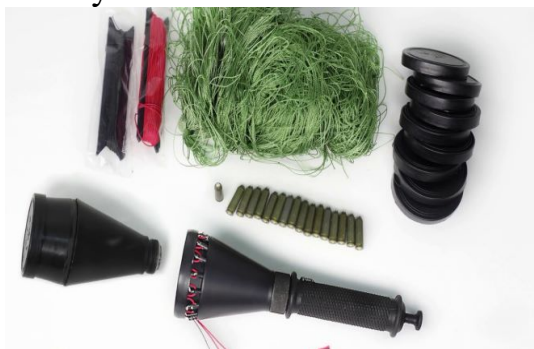
Рисунок 10. Средство сковывания движения

10. Средства сковывания движения (рисунок 10) – это технические изделия, предназначенные для сковывания биологических объектов («Невод»). Принцип работы заключается в набрасывании поверхностного элемента (сеть) на биологический объект. Средства сковывания движения применяются в случаях, предусмотренных пунктами 1–5 части 1 статьи 21 ФЗ «О полиции».