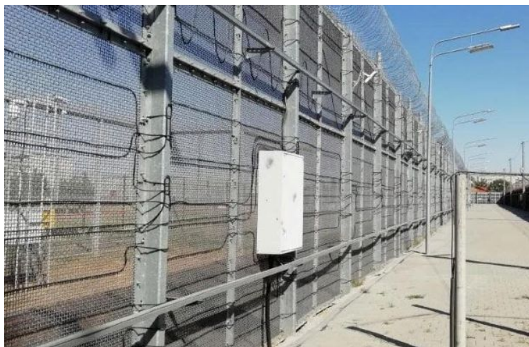
Рисунок 13. Ограждение охраняемого объекта

13. Средства защиты охраняемых объектов (территорий), блокирования движения групп граждан, совершающих противоправные деяния – это технические устройства, выполненные в виде шлагбаумов, колючих лент, спиралей (рисунок 13). Они предназначены для защиты охраняемых объектов и территорий от незаконного проникновения и захвата, блокирования движения огромной массы людей. Средства защиты охраняемых объектов (территорий), блокирования движения групп граждан, совершающих противоправные деяния, применяются в случаях, предусмотренных пунктом 11 части 1 статьи 21 ФЗ «О полиции».