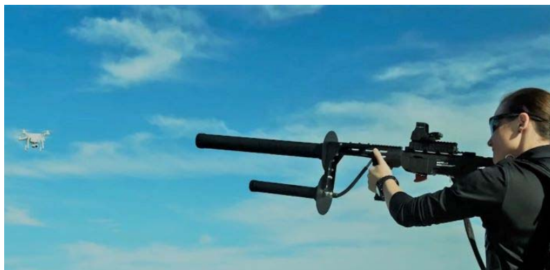
Рисунок 15. Использование специальных технических средств противодействия беспилотным воздушным судам

15. Специальные технические средства противодействия беспилотным воздушным судам (рисунок 15) – это технические устройства, которые подавляют или преобразовывают сигнал дистанционного управления беспилотных воздушных судов (дронов, квадрокоптеров). Специальные технические средства противодействия беспилотным воздушным судам применяются в случаях, предусмотренных пунктом 12 части 1 статьи 21 ФЗ «О полиции».