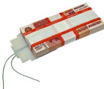
Рисунок 4. Химическая ловушка

4. Специальные окрашивающие и маркирующие средства, к данной категории относятся так называемые химические ловушки, которые содержат краску (рисунок 4). При контакте с правонарушителем ловушка взрывается, краска попадает на его одежду и тело, тем самым помогая сотрудникам правоохранительных органов его выявить. Специальные окрашивающие и маркирующие средства применяются в случаях, предусмотренных пунктами 10 и 11 части 1 статьи 21 ФЗ «О полиции».