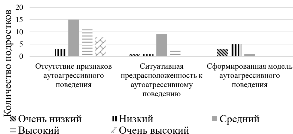
Рисунок 3. Уровень эмоционального интеллекта подростков с учетом сформированности аутоагрессивного поведения.

Полученные данные свидетельствуют о том, что большинство подростков обладают средним уровнем эмоционального интеллекта, что выражается в способности определять, какие эмоции они сейчас испытывают, но контролировать свое поведение вызывает у них затруднения. Далее рассмотрим в какой степени сформирован эмоциональный интеллект в зависимости от склонности подростков к аутоагрессивному поведению (см. рис. 3).