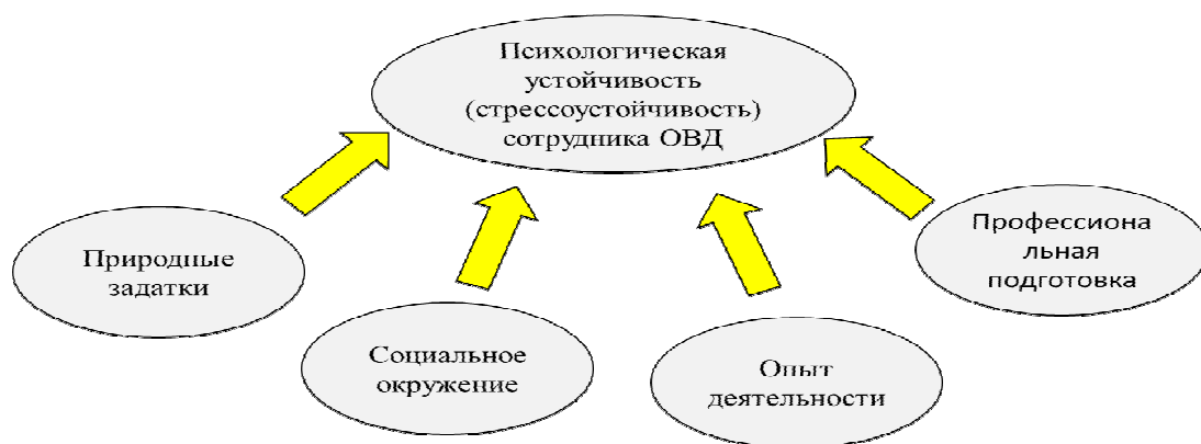
Рис. 1. Факторы, влияющие на формирование профессиональных качеств

В ходе обучения и подготовки сотрудников различных специальностей следует учитывать многие факторы для формирования необходимых профессиональных качеств (рис. 1). Но вместе с этим, как показала практика, сотрудникам не всегда удается правильно и в полном объеме использовать сформированные свои умения и навыки даже при изменении критерий служебной деятельности [2].