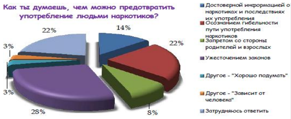
Рис. 3. Чем можно предотвратить употребление молодежью наркотиков?

Большинство респондентов (28%) ответили, что только ужесточением закона, 22% – только при получении достоверной информации и о сознании пагубном влиянии наркотиков на молодой развивающийся организм. И 3% даже затрудняются ответить на этот вопрос.