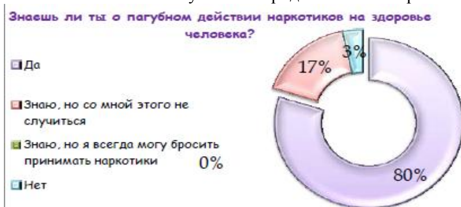
Рис. 2. Знания молодежи о пагубном действии наркотиков

Науке давно известно пагубное и разрушительное влияние наркотиков на организм и здоровье. Но знает ли наша, современная молодежь о действии этого зелья? Результаты представлены на рис. 2.