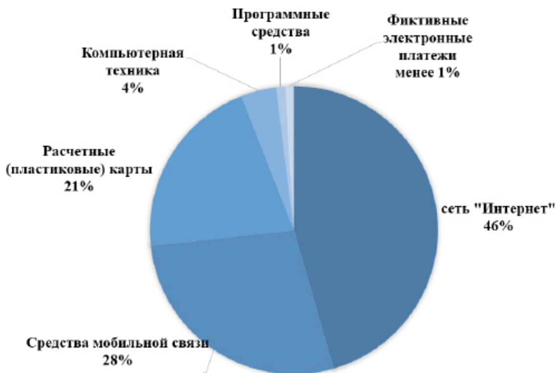
Рис. 2. ИТ-технологии, использовавшиеся для совершения преступлений в 2021 году*