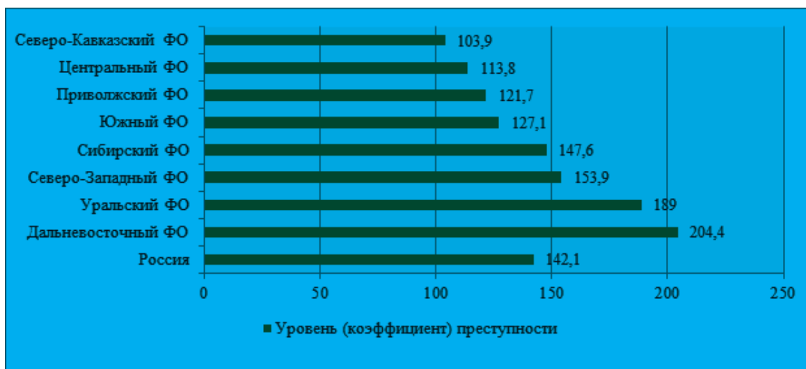
Рис. 3. Уровень преступности в Российской Федерации по федеральным округам в 2017 г.

(в 2016 г. – 137,3). При этом максимальное значение данного показателя фиксируется в Дальневосточном федеральном округе, минимальное – в Северо-Кавказском федеральном округе (рис. 3).