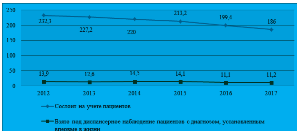
Рис. 4. Динамика отдельных показателей заболеваемости наркологическими расстройствами в Российской Федерации в 2012-2017 гг. на 100 тыс. населения

В последние годы заболеваемость наркологическими расстройствами постепенно снижается [1, с. 47]. Ее уровень по итогам 2017 г. составил 186 человек на 100 тыс. населения (в 2016 г. – 199,4 человек; - 6,7%) (см. рис. 4).