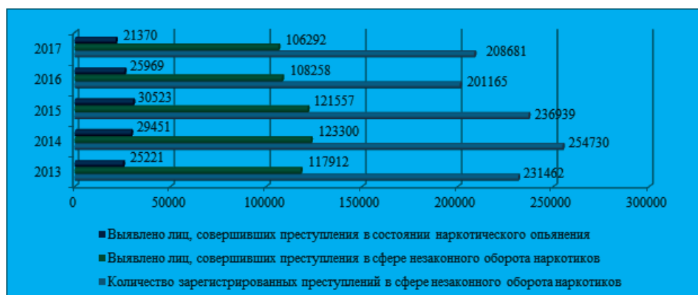
Рис. 1. Динамика отдельных показателей, характеризующих преступность в сфере незаконного оборота наркотиков (2013-2017 гг.)

Криминологический анализ преступности в Российской Федерации показывает, что в 2017 г. на фоне незначительного роста количества зарегистрированных преступлений, связанных с незаконным оборотом наркотиков (+3,7% к 2016 г.) 2 , отмечено снижение числа лиц, выявленных за их совершение (-1,8%) и совершивших преступления в состоянии наркотического опьянения (-17,7%) (рис. 1).